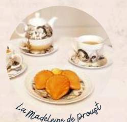
La Madeleine de Proust