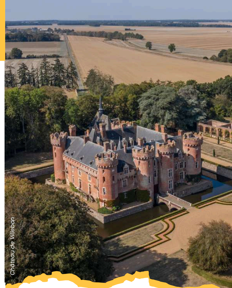
Château de Villebon